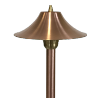
SPE700 (largeur: 7")