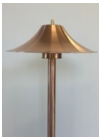
SPE1000 (largeur: 10")